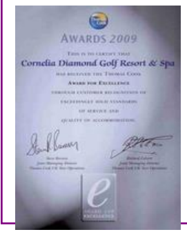
AWARD for EXCELLENCE