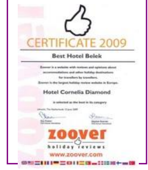
ZOOVER – BEST HOTEL BELEK