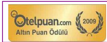
OTEL PUAN - GOLD