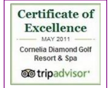
TRIP ADVISOR – CERTIFICATE of EXCELLENCE