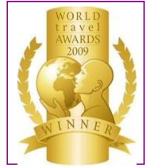
WTA – Europe's Leading Spa Resort