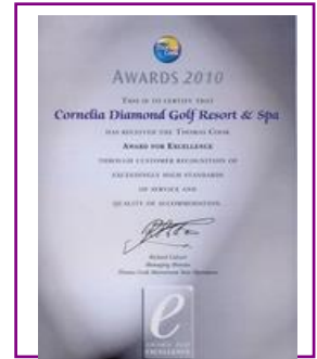
MARK for EXCELLENCE