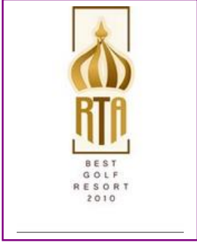
RUSSIAN TRAVEL AWARDS