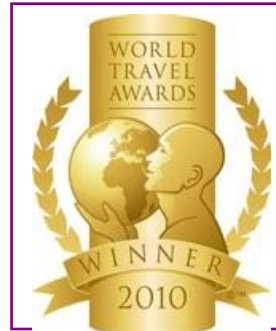
WTA – World's Leading All Inclusive Golf Resort