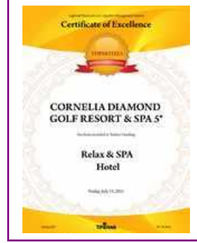
TOPHOTELS – Turkey's Leading Relax & SPA