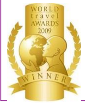
WTA – Europe's Leading Golf Resort