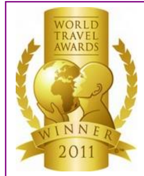
WTA – World's Leading Fully Integrated Resort