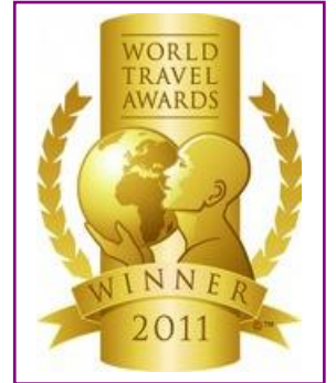
WTA – Europe's Leading Resort Villa