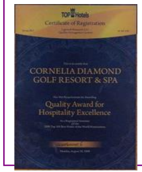
TOPHOTELS – AWARD for EXCELLENCE