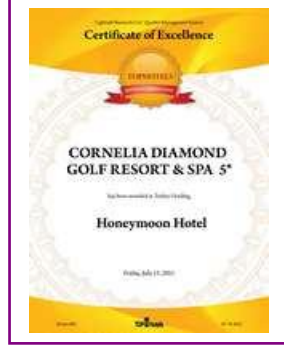
TOPHOTELS – Turkey's Leading Honeymoon