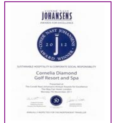
CONDE NAST JOHANSENS – WINNER (Sustainable Hospitality and Corporate Social Responsibility 2012)