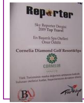
REPORTER MAG. – BEST SPA HOTEL