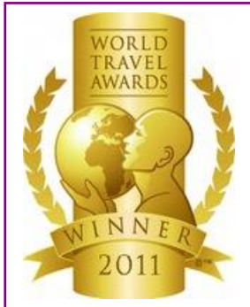
WTA – Europe's Leading Luxury Resort