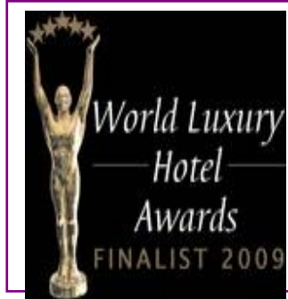
WORLD LUXURY – LUXURY GOLF RESORT