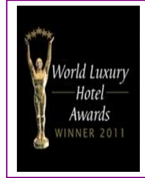
WORLD LUXURY – BEST LUXURY GOLF RESORT