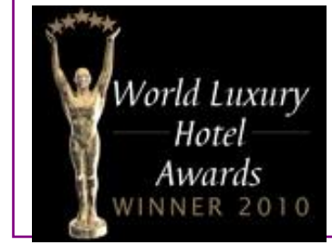
WORLD LUXURY – BEST LUXURY GOLF RESORT