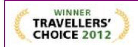
TRIPADVISOR – Top 25 All Inclusive Resorts in Europe