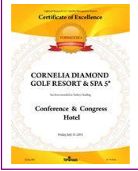
TOPHOTELS – Turkey's Leading Conference