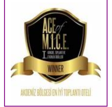
ACE of MICE – Best Congress Hotel in Antalya