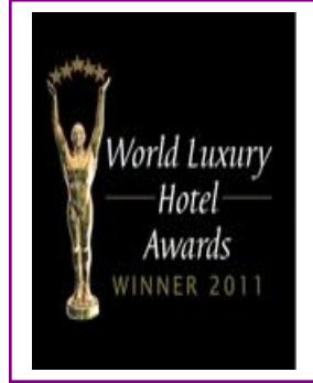
WORLD LUXURY – BEST LUXURY SPA RESORT