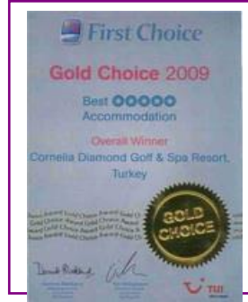
FIRST CHOICE – GOLD CHOICE