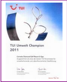
TUI – UMWELT CHAMPION