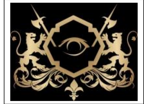
EYE AWARD – EUROPE'S BEST SPORT HOTEL