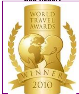
WTA – Europe's Leading Spa Resort