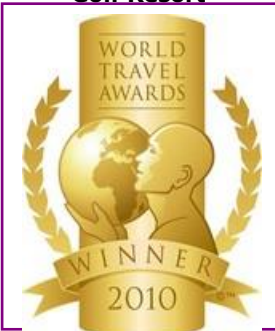
WTA – Europe's Leading Luxury Resort