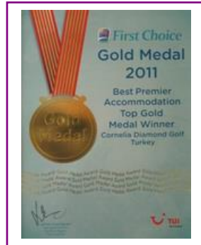
FIRST CHOICE – GOLD MEDAL