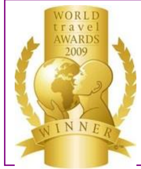
WTA – Turkey's Leading Spa Resort